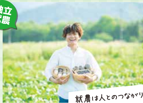
就農は人とのつながり