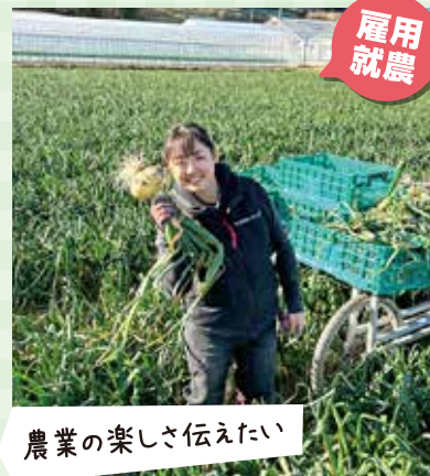
農業の楽しさ伝えたい

農業については、さまざまな情報が世間にはありますが、まずはやってみる事が大切だと思います。やってみて感じることもあるので、まずはインターンシップなどの情報を手に入れ、実際に作業してみることが大切だと感じます。農業はとてもやりがいのある仕事ですので、色々な場所で農業を体験しながら、自分に合った農業を見つけていただければと思います。